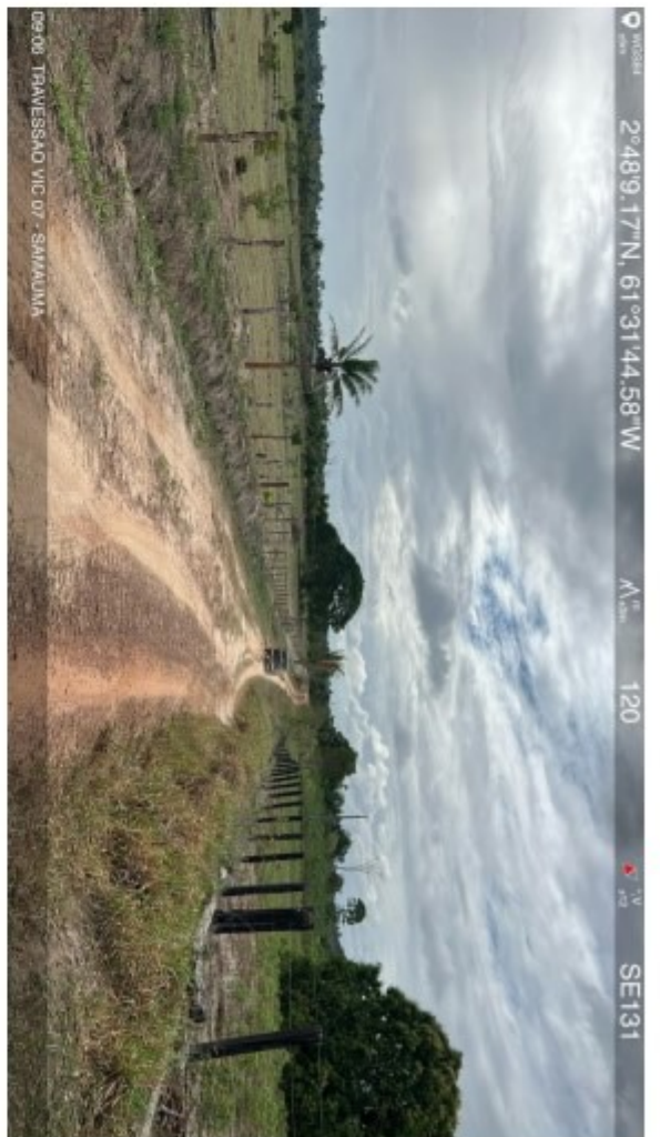
Travessão vic 07 Samauma (10).jpeg