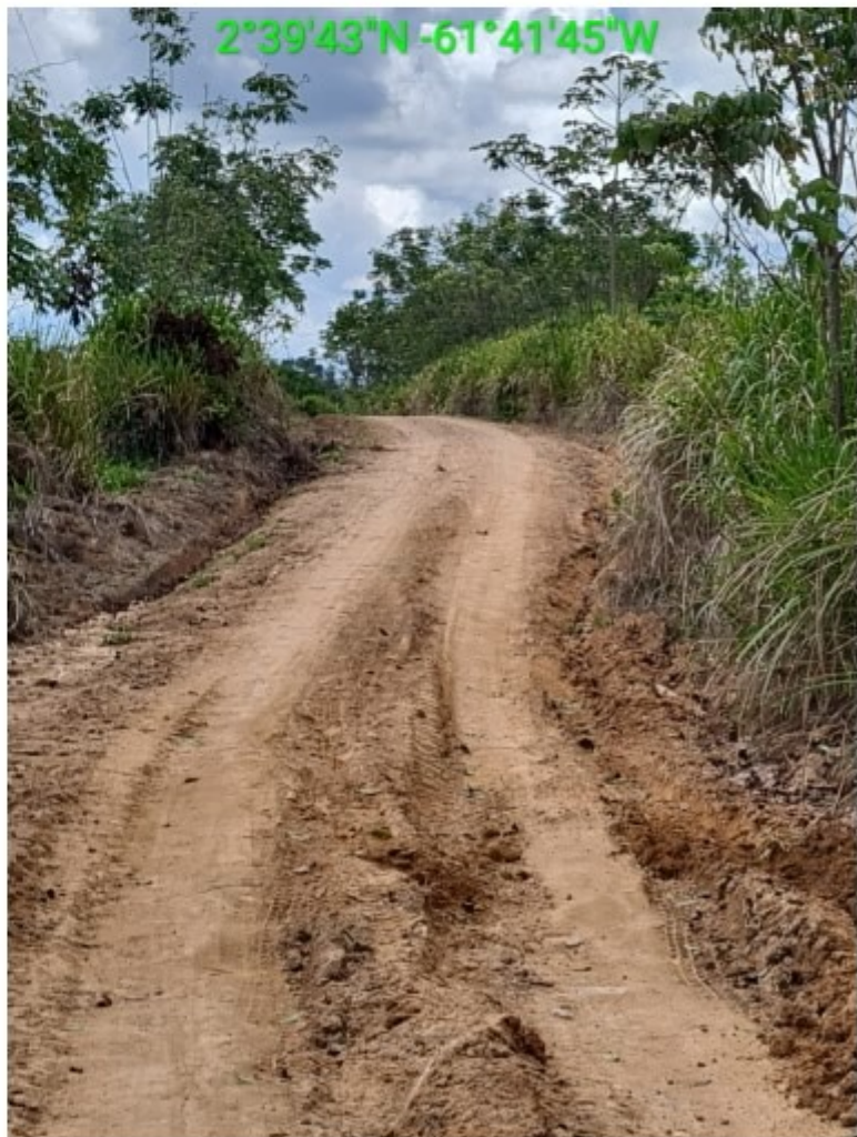
vic 17 vila nova (6).jpg