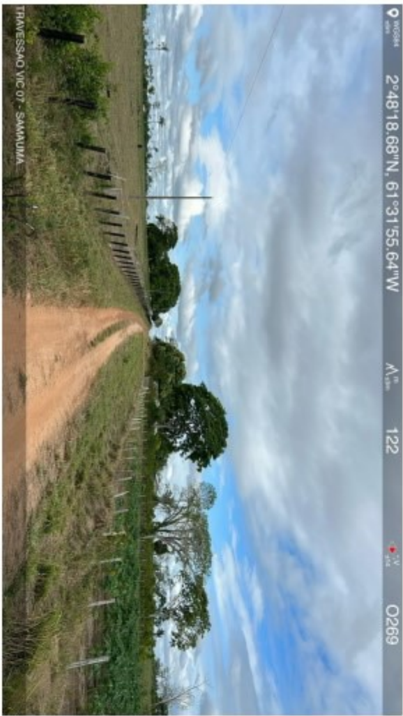
Travessão vic 07 Samauma (7).jpeg