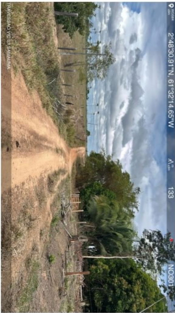
Travessão vic 07 Samauma (3).jpeg