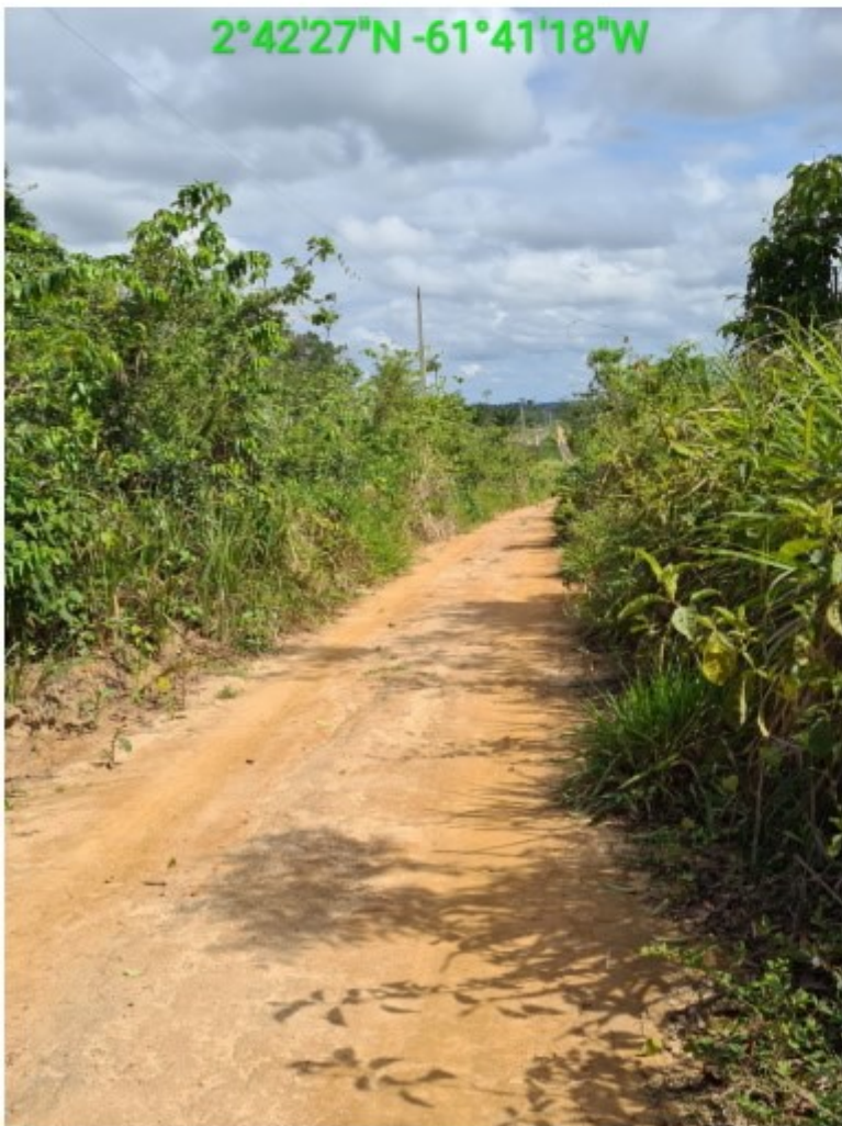
vic 17 vila nova (1).jpg