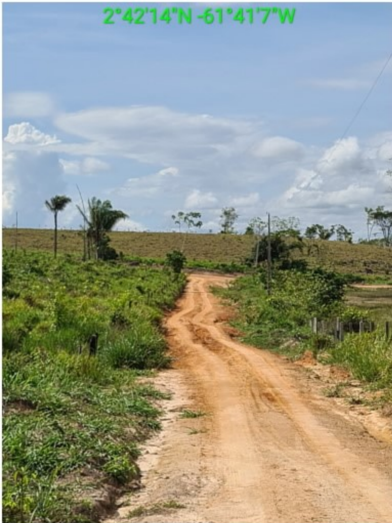
vic 17 vila nova (3).jpg