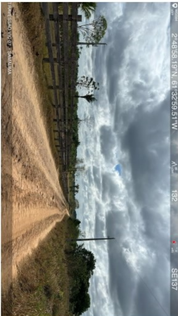
Travessão vic 07 Samauma (5).jpeg