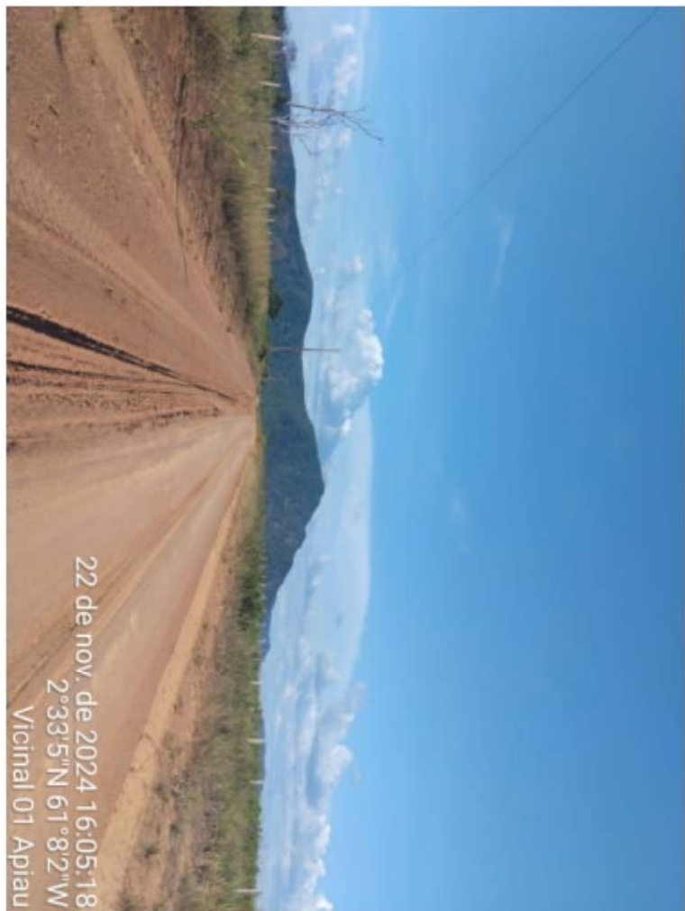
vic 01 - APIAU (1).jpeg