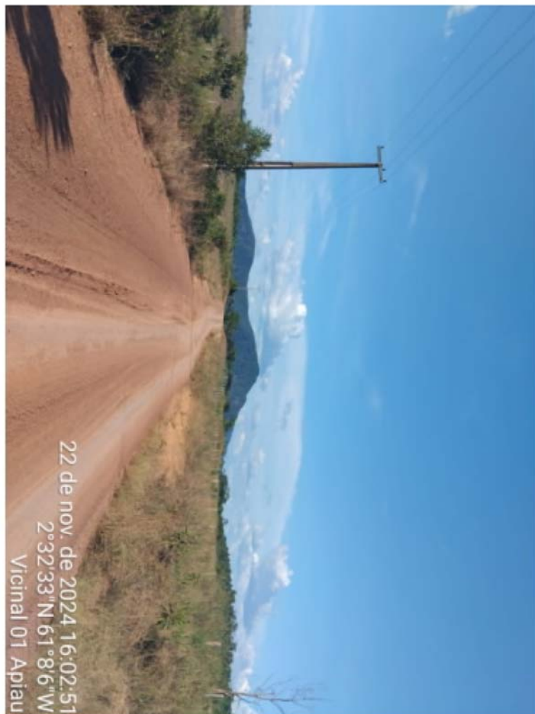
vic 01 - APIAU (4).jpeg