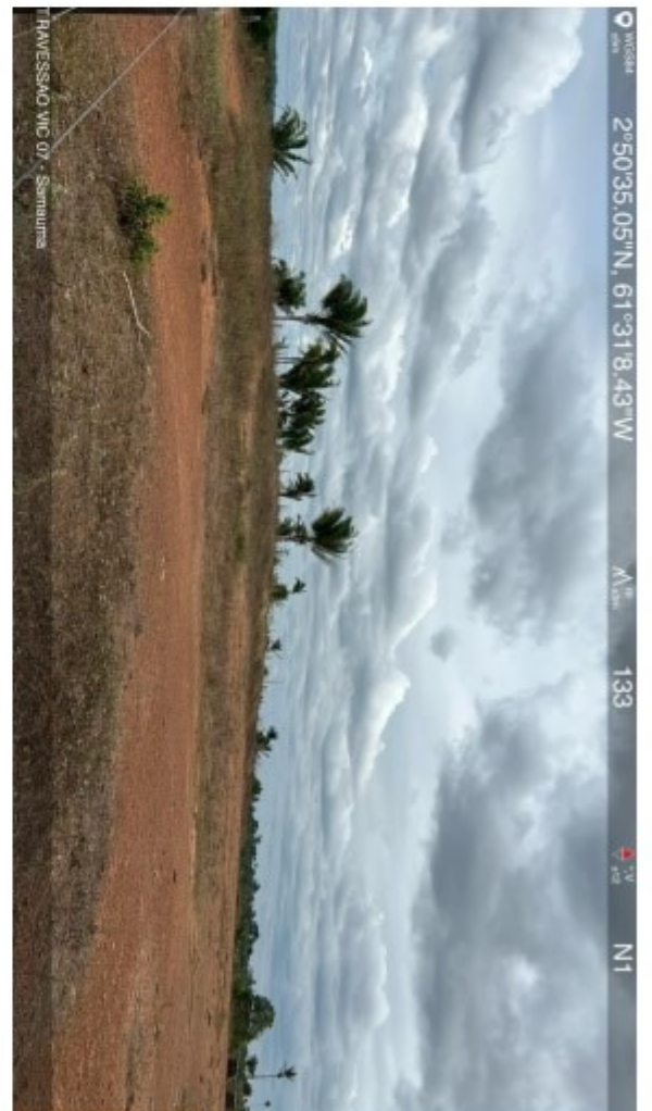
Travessão vic 07 Samauma (6).jpeg