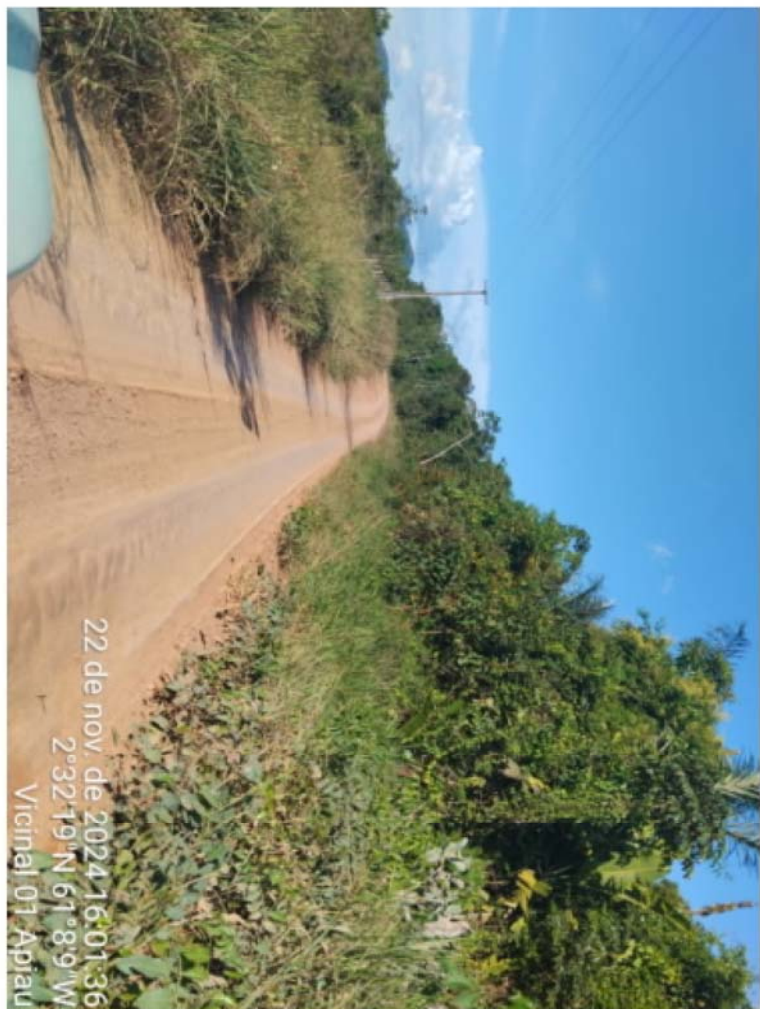
vic 01 - APIAU (3).jpeg