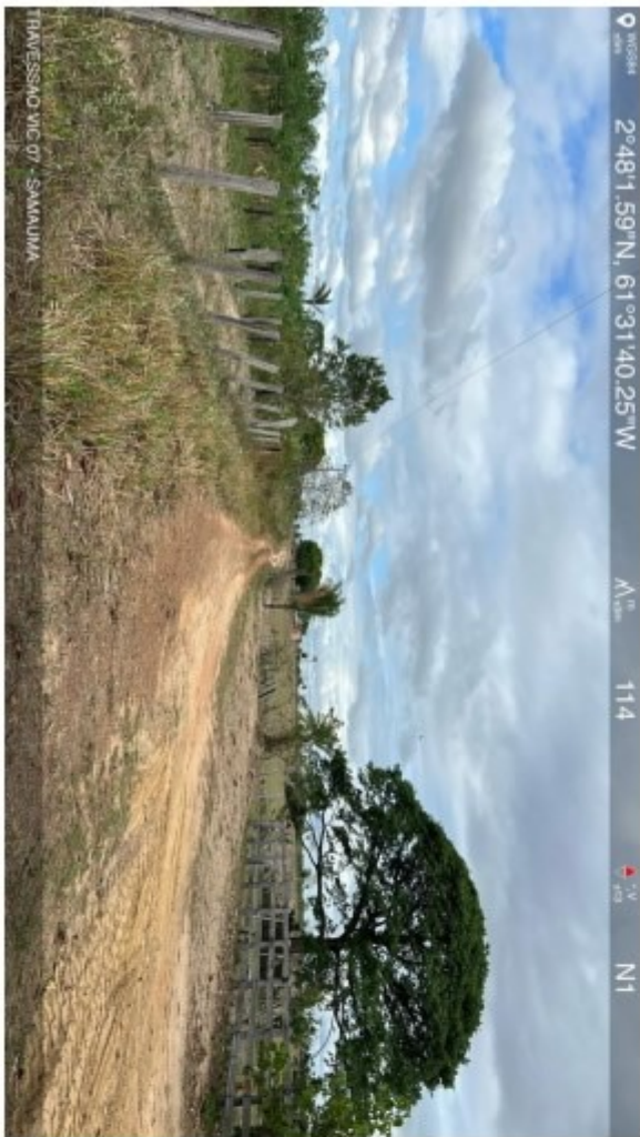
Travessão vic 07 Samauma (11).jpeg