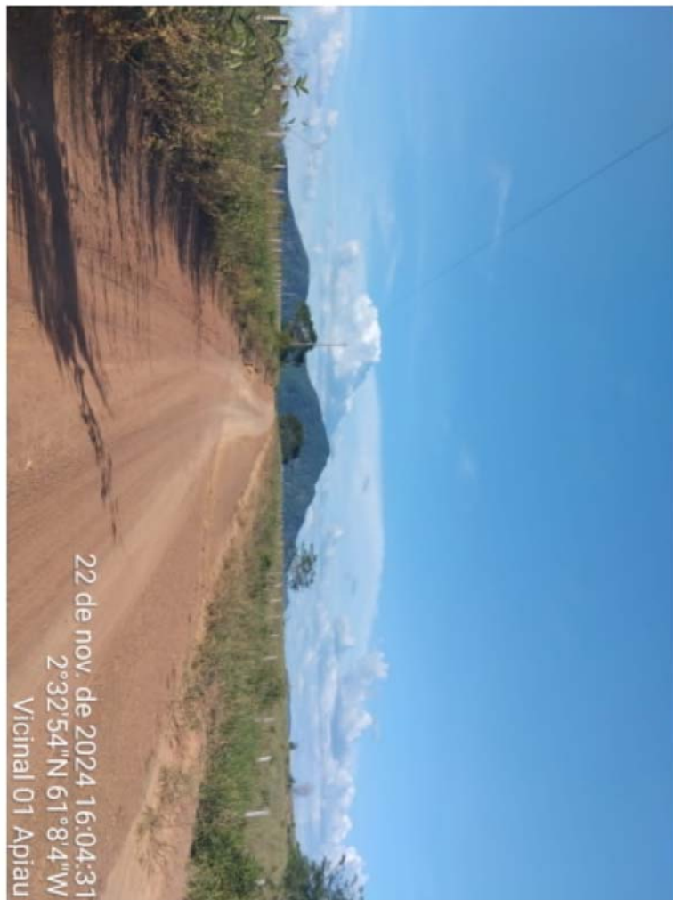
vic 01 - APIAU (2).jpeg