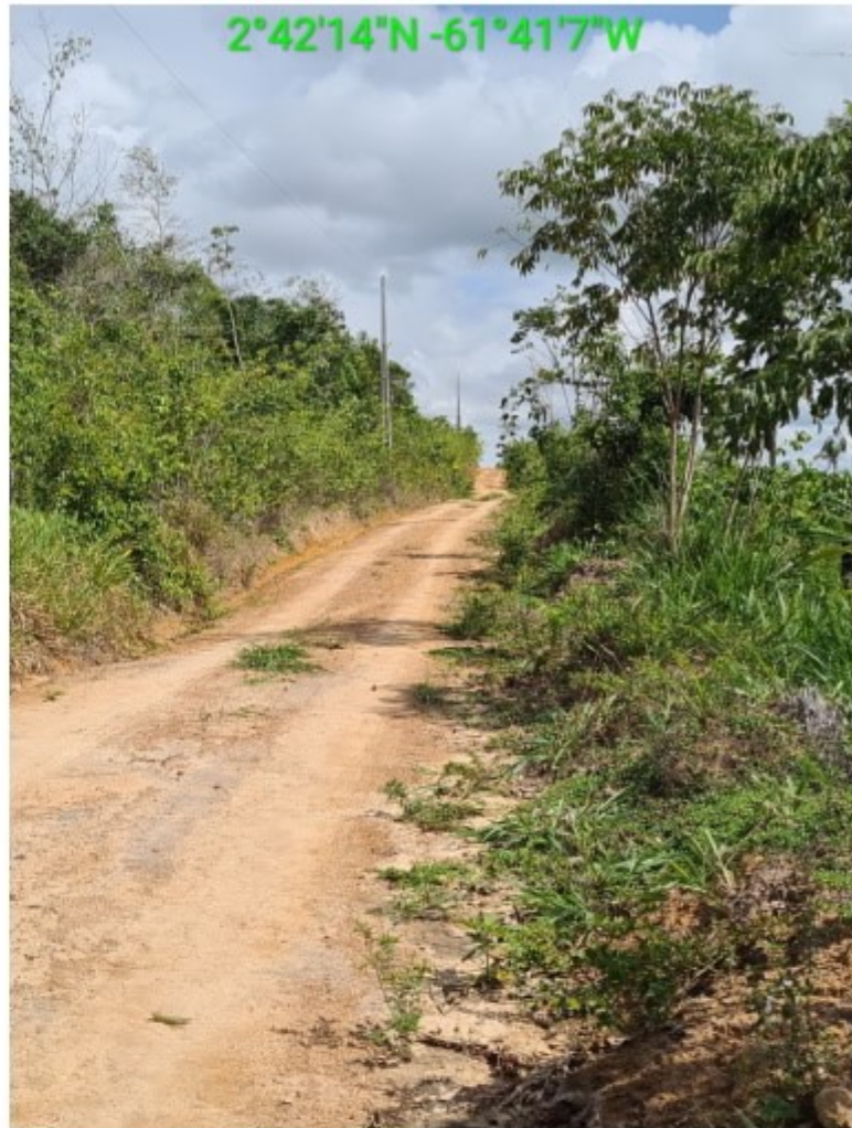
vic 17 vila nova (4).jpg