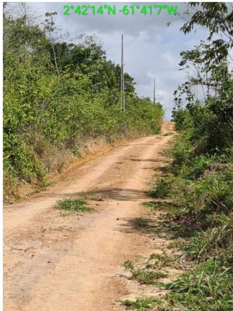
vic 17 vila nova (2).jpg