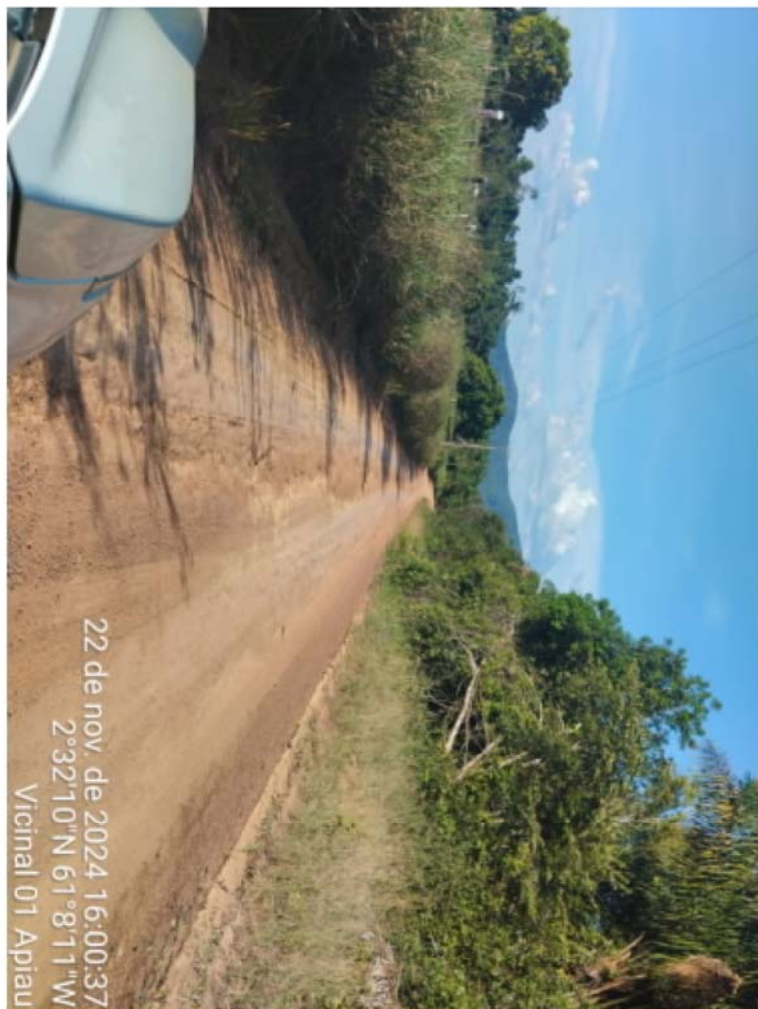
vic 01 - APIAU (7).jpeg