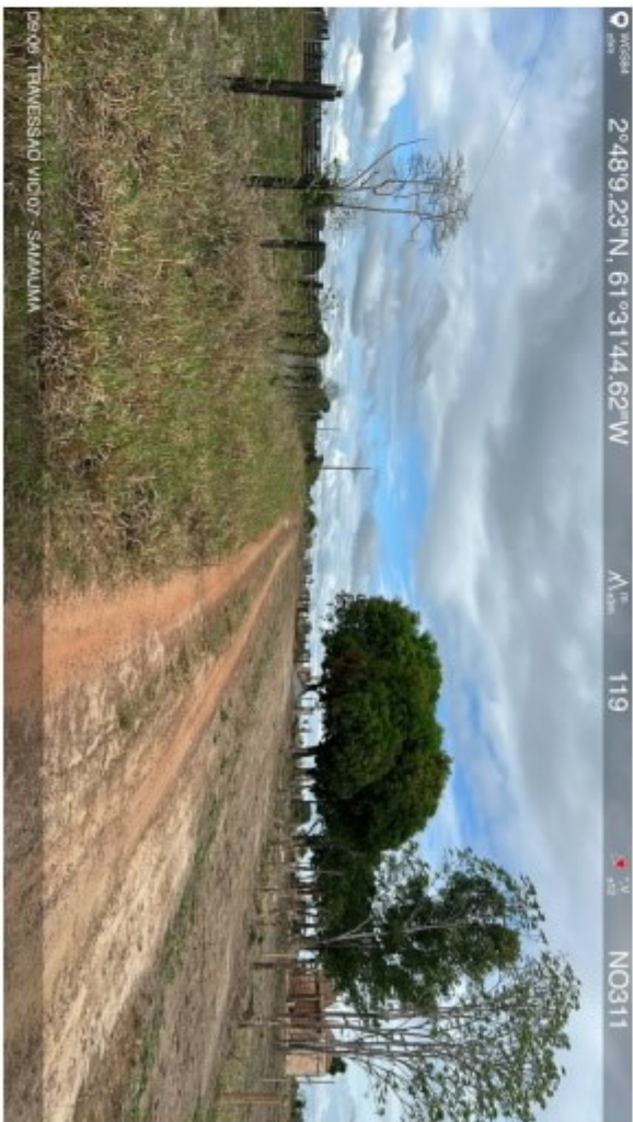
Travessão vic 07 Samauma (9).jpeg