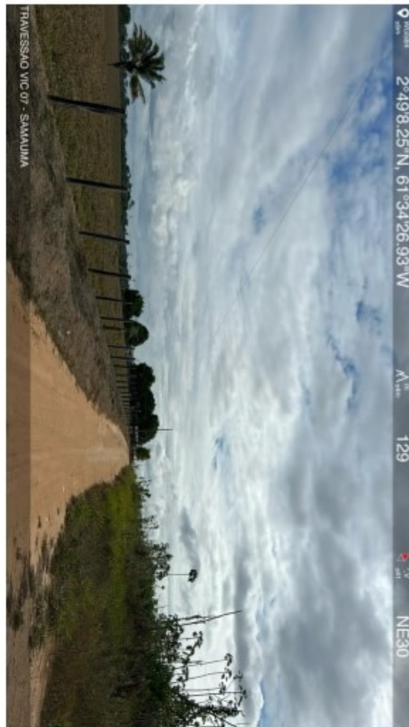
Travessão vic 07 Samauma (12).jpeg