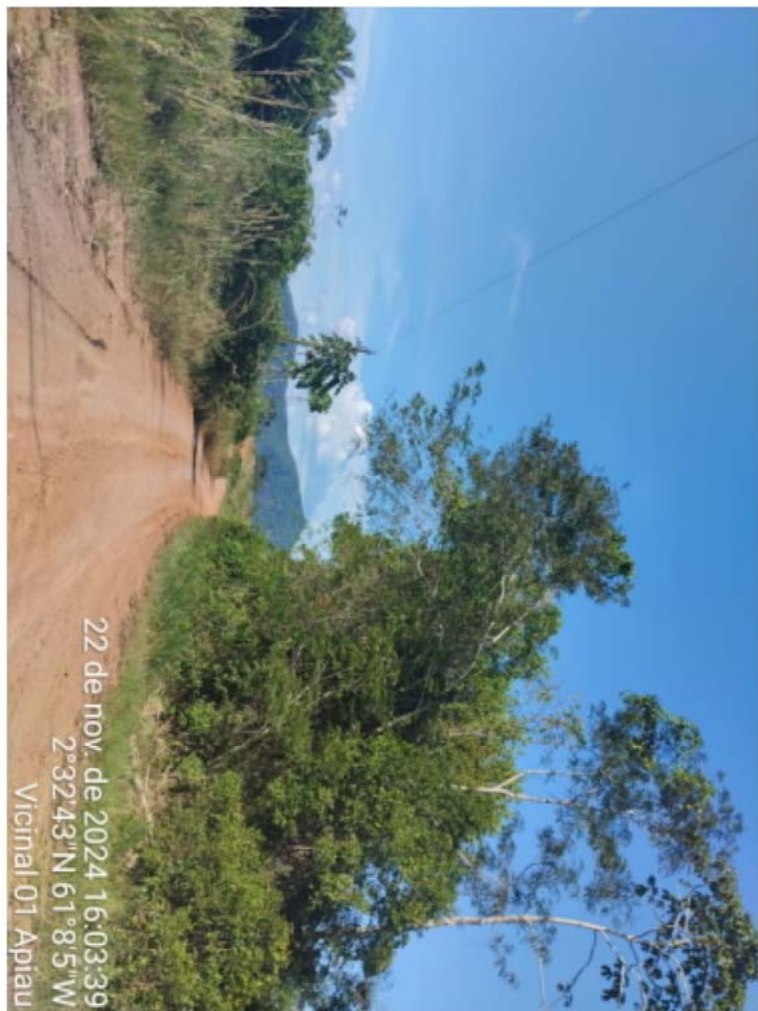
vic 01 - APIAU (5).jpeg