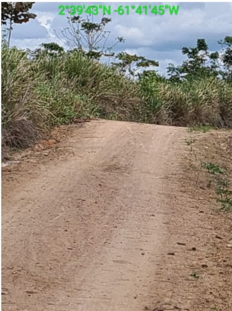
vic 17 vila nova (5).jpg