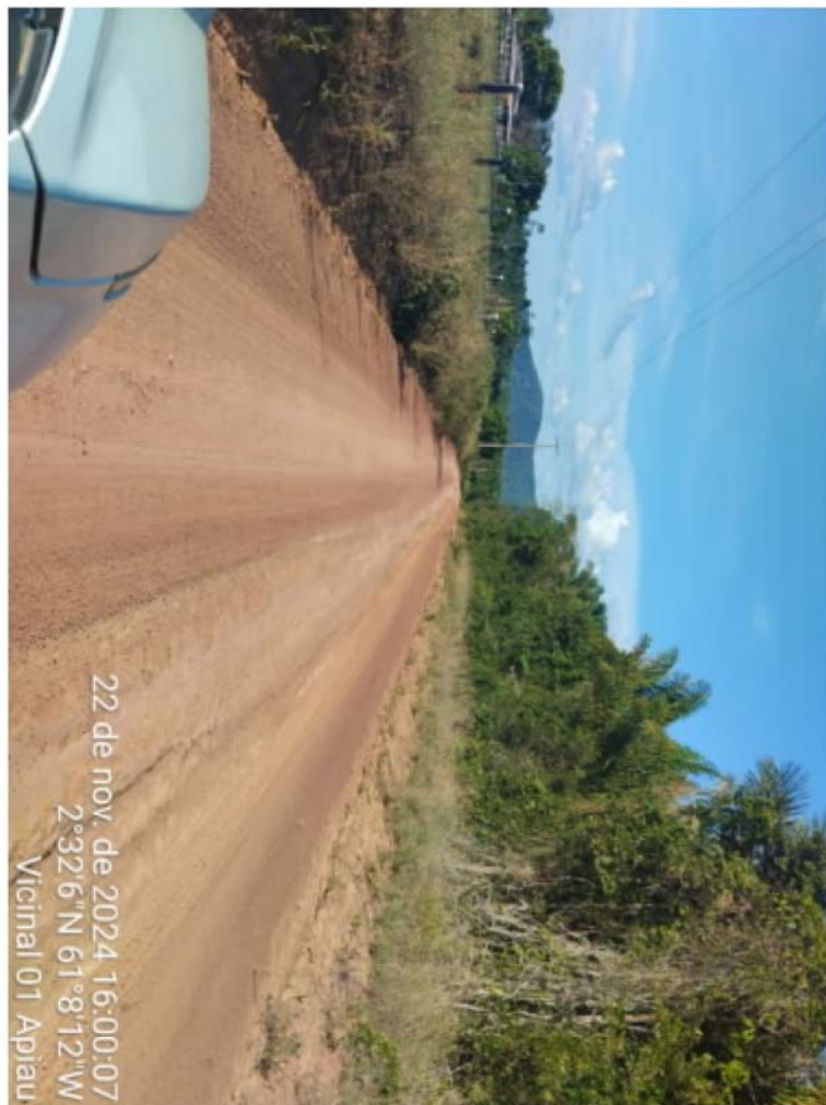
vic 01 - APIAU (6).jpeg